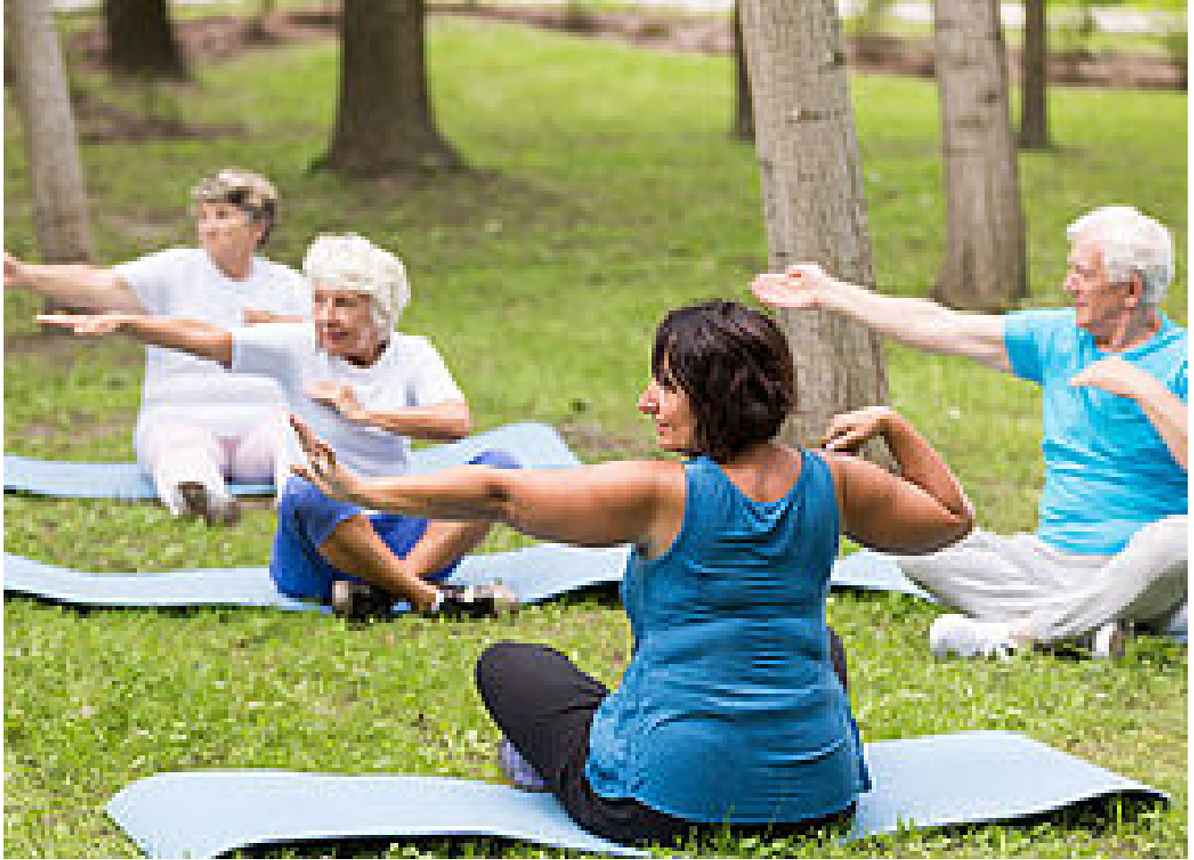
CONFÉRENCE DES FINANCEURS