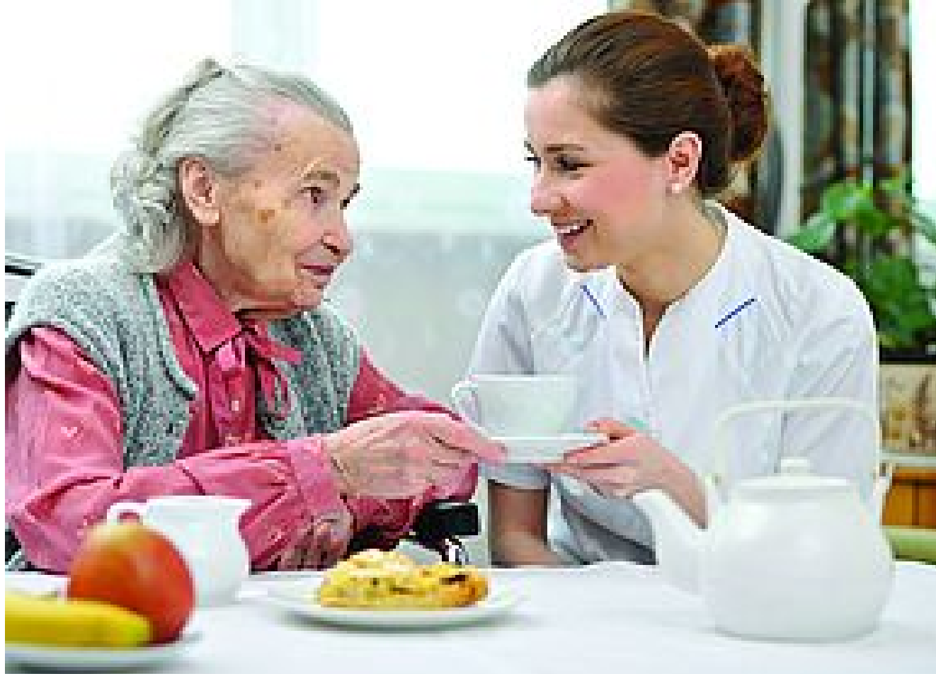
SERVICES D'AIDE ET D'ACCOMPAGNEMENT À DOMICILE