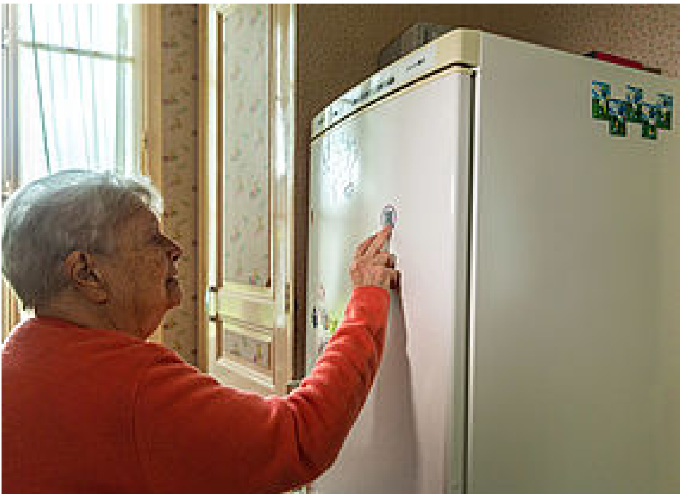
PLAN OISE SÉNIORS