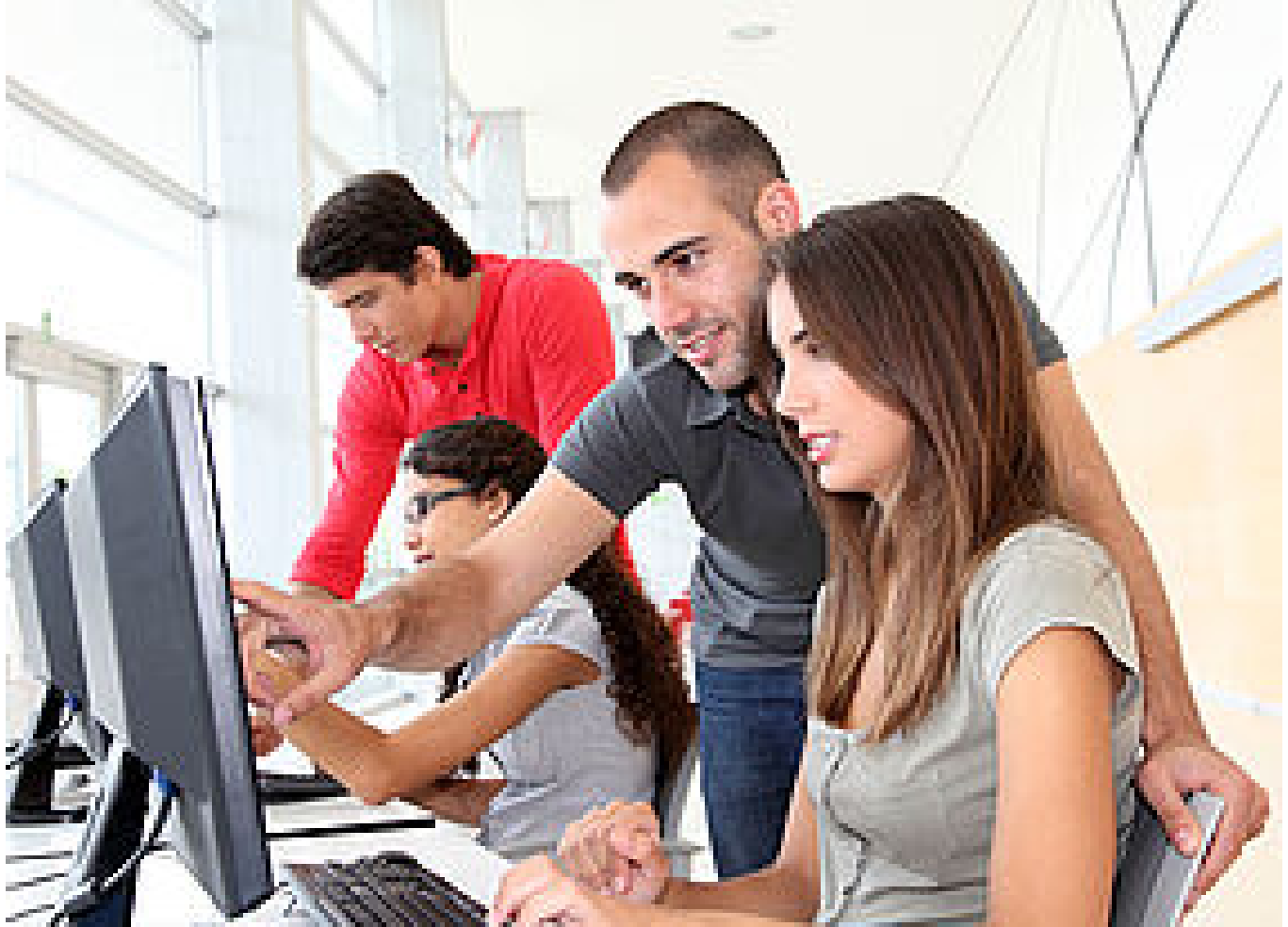
LA NUMÉRITHÈQUE DÉPARTEMENTALE