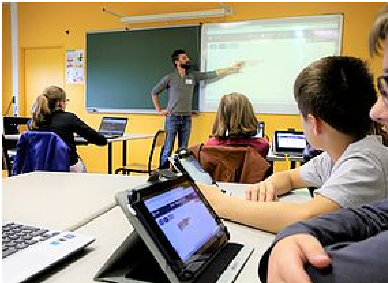
LA CLASSE MOBILE